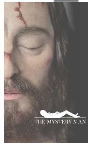
THE MYSTERY MAN